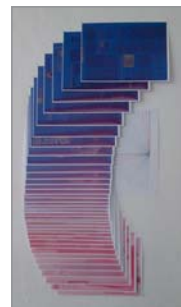
Hyacinth turning blue