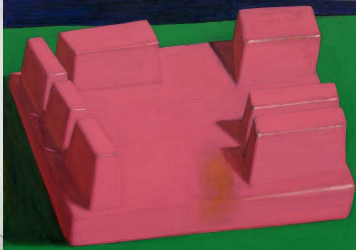
Johann Sturcz Chocolate with yellow stain